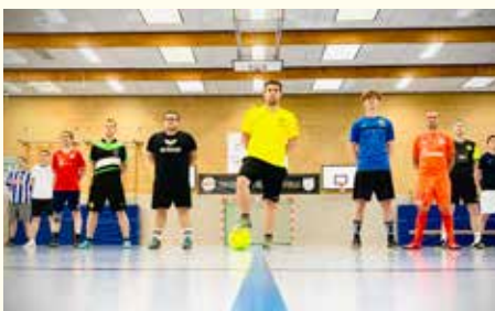
Jeden Montag treffen sich die Fußballer zum gemeinsamen Kicken in der Dreifachturnhalle.