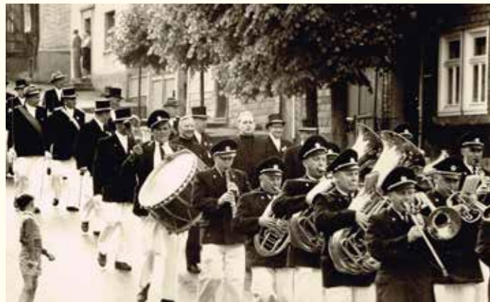
Festzug um 1960

„Pfingsten, das liebliche Fest, war in der Heimat nicht weniger schön als Weihnachten und Ostern. Dann wurde ja zugleich das Schützenfest gefeiert. Pfingsten kommt jeder ordentliche Warsteiner, der sich in der Fremde befindet, nach Hause, so hieß es. Und so war es in der Tat. Die Eisenbahnen nach Lippstadt und Soest waren noch nicht gebaut. 3) Die „Heimkehrer“ kamen fast ausnahmslos über Meschede. Von dort wurden sie am Nachmittag vor Pfingsten mit allerlei Fuhrwerk, u. a. mit Birkenbüschen geschmückten Leiterwagen, auf denen Brettsitze angebracht waren, abgeholt. Mit Jubel wurden die Verwandten und Freunde in der im Festgewand prangenden Stadt empfangen. Alle waren fröhlich und selig. Herrliches Glockengeläut erschallte