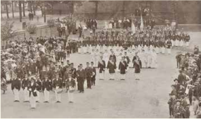
Parade Markplatz 7.6.1907

zum Gruß und gleichzeitig zur Einleitung des Festes. Am 1. Pfingsttag war nachmittags im Schützenzelt auf dem Herrenberge Festkonzert. 4) Am zweiten Tag fand vormittags die große Prozession statt, die von 8 bis 1 Uhr dauerte, und an der beide Schützengesellschaften - die „Alten Schützen“ und die „Jungen-Schützen“ mit ihren Musikchören teilnahmen. Das war schön und feierlich. Die Prozession führte am Walde – am „Borstholte“ und „am Tiüppel“ vorbei. 5) Ich schätzte die Prozession besonders, weil wir im Walde austreten und etwas genießen durften. Uns gab Mutter regelmäßig ein gut mit Butter belegtes Brötchen und ein ansehnliches Endchen gekochte Mettwurst mit. Das schmeckte mir dann so vorzüglich, dass ich heute noch gern daran zurückdenke.