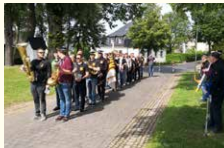
Traditionell feiert der FKK Warstein am Pfingstfreitag das Inselschützenfest auf dem Kohlmarkt.