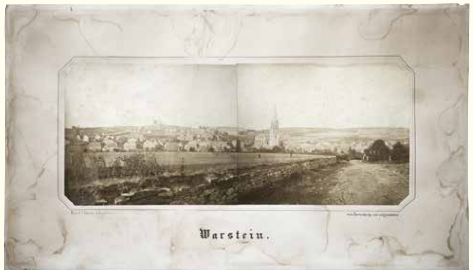
Warstein vom Herrenberg aus