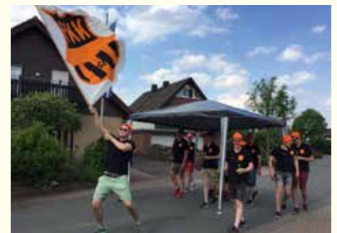
2017 veranstalteten die FKK-Brüder erstmals auch eine Bierprozession durch Warsteins Norden.