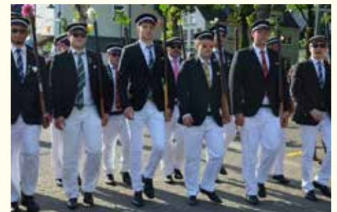
Ab Pfingstsamstag wird dann das Ornat der Schützen getragen.